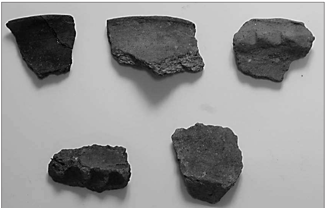
Слика 4 – Средњовековна грнчарија

Изузетан стратешки положај овог утврђења потврђен је и каснијим турским дефтерима. Припадници више околних села