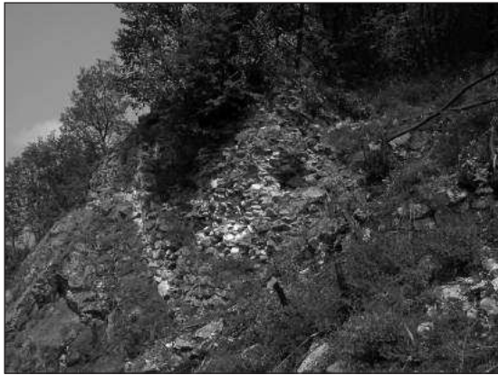
Слика 2 – Остаци јужног бедема

су осећај потпуне сигурности. Једино је био могућ прилаз са југоисточне стране, одакле се и данас долази. Наспрам Градине, према југу доминира планина Малич, са највишом котом од 1100 m.