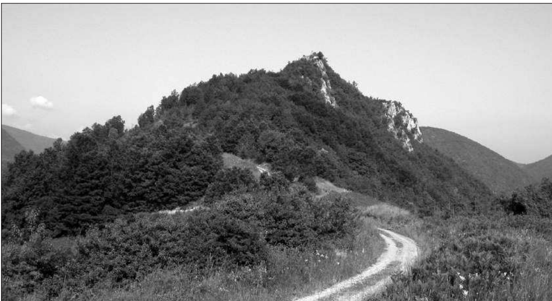
Слика 1 – Градина, поглед са истока