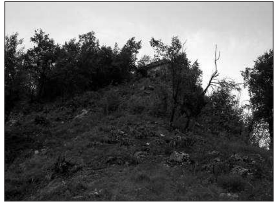
Слика 3 – Поглед на цркву са југа